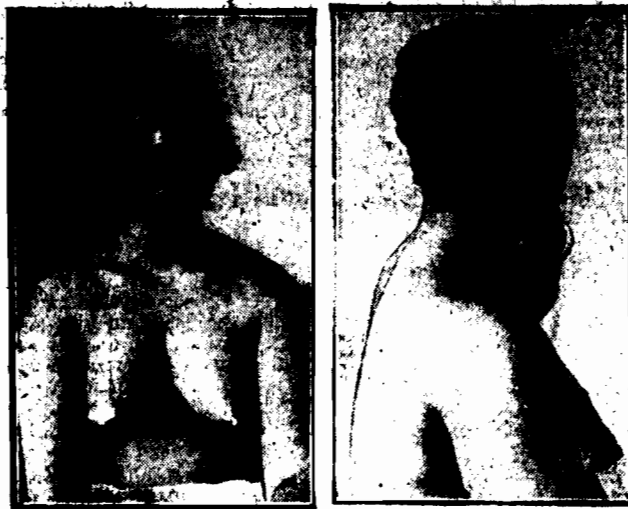
Murzynki ze szczepu „Bangala” uprawiają fryzurę przypominającą zasadniczo wyszłą matematykę. Oto przyrząd (tabela kultury) na swoich głowach rozciągają kwadraturę koła przy pomocy układania włosów w formie misternie ułożonych kwadratków. Przeróżnawana fryzura nie przeszkadza murzynkom ze szczepu „Bangala” w spożywaniu mięsa ludzkiego.